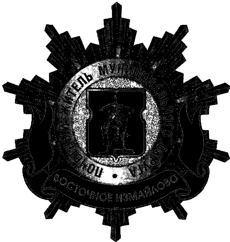
Рисунок нагрудного знака к званию «Почетный житель внутригородского муниципального образования – муниципального округа Восточное Измайлово в городе Москве»

Приложение 3 к решению Совета депутатов внутригородского муниципального образования – муниципального округа Восточное Измайлово в городе Москве от 18.02.2025 года №12